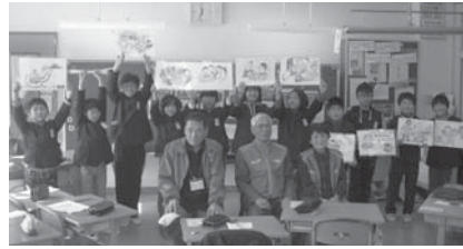
出前講座で活躍する紙芝居「アイドリング・ストップ物語」

Q4 会長のモットー なんとと言っても「気力!」が大事。やることはどんどんやる、困難なことに出くわしても「負けてたまるか!」「石の上にかじりついて3年」の精神で頑張っています。困った時には、公衛協の仲間が助けてくれます。公衛協の活動が住民、地元企業、町長をはじめ行政との協働へとつながるように、私は「活動の火」をいろいろな所に灯して回る役に徹しています。