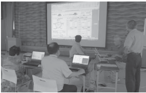
診断ソフトの使い方、入力方法を学ぶ(上)、診断結果をもとに模擬相談を実施(右)

本セミナーは、公衆衛生推進協議会および地球温暖化対策地域協議会関係者、地球温暖化防止活動推進員を対象に、「基礎編」と「成果共有編」の2回シリーズで構成し、基礎編で「省エネ相談」の手法を習得します。その後、各地域で実践して、成果共有編で実践内容を報告・共有します。