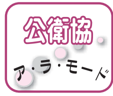
② 海田町公衛協 【イベントでの普及啓発】

9月27日、海田町で「空き缶等散乱ごみ追放キャンペーン」と「エコと瀬野川環境フェア」が開催されました。