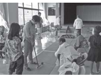
軽運動コーナーを楽しむ参加者

生活の不安解消と心身のリフレッシュを図ることがねらいです。公衛連は、軽運動コーナーと脱温暖化コーナーを担当しました。「健康豆とろ」お皿にあ