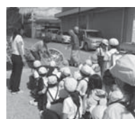
脱温暖化出前学習 (福山市樹徳学区公衆衛生推進委員会)

※この表は、平成30年9月末までに市町公衛協事務局から募金委員会に振込みのあった実績額を示しています。