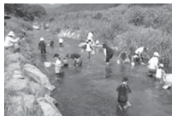
水辺教室 (北広島町公衆衛生推進協議会)