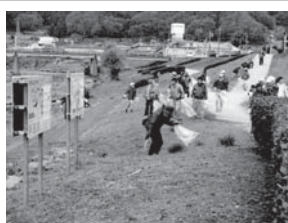
芦田川等一斉清掃 (府中市公衆衛生推進委員会連合会)

※この表は、2019年5月末までに、市町公衛協事務局から募金委員会に振込みのあった実績額を示しています。