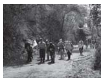
公衛協発ウォーキング事業