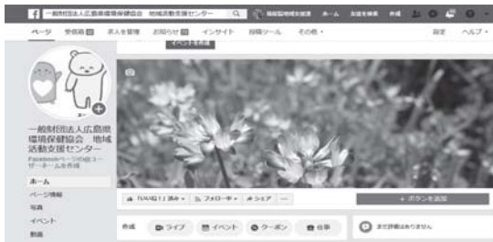
当協会のフェイスブックに参加者の記事が投稿

八ウを、体験を通して習得する研修で、より広く、幅広い年齢層へ向け、鮮度のいい情報発信ができる記者の育成をねらいに実施しています。 午前中は、座学を中心とし、テレビや新聞で取り上げられる「炎上」など実例も交えて注意点を学びました。午後からは、ご自身のスマートフォンを利用して、Facebookに登録し、実際に記事を投稿することで、他人の投稿へ「いいね」や「シェア」などにより、情報が広まっていく様子を体験してもらいました。