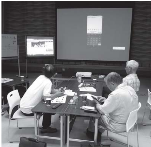
スマホを手に使用方法を学習する参加者

6月8日、「広報・ツールづくりコース」Facebook記者養成編を開催し、2公衛協とTEAMが