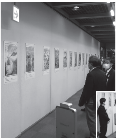
瀬戸内海のポスター原画(上)と記念撮影する児童・生徒(右)

環境と健康のポスター・標語コンクールは、毎年、広島県公衆衛生大会の場で、入賞作品の展示を行っています。今年度は、会場のギャラリーを使用し、作品の展示を行いました。受賞者の児童・生徒は自分の作品の前で記念撮影をする姿が見られました。