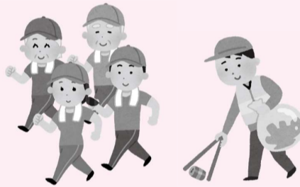
(地域活動支援センター)

チェック後に取り組むフレイル予防策として、これまで公衛協で実施してきた「ウォーキング事業」や