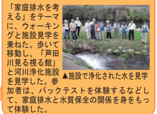
▲施設で浄化された水を見学した。参加者は、バックテストを体験するなどして、家庭排水と水質保全の関係をもっと体験した。