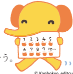
▲ウォーキングPRキャラクター「あるくソウ」