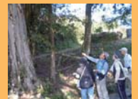
▲津名地区では史跡などを巡った

世羅町の良さを再発掘する目的で行った「まるごとエコツアー」と組み合わせ、さまざまな場所で開催して町民の関心を引き出した。