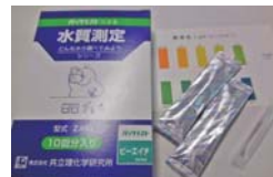
COD(D) 10本入り1箱 PH 10本入り1箱