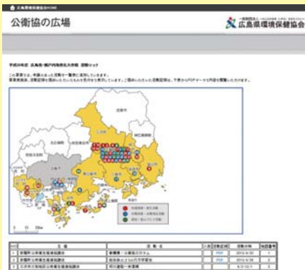
※写真は平成25年度の実績

公衛協の広場: http://www.kanhokyo.or.jp/chiiqi/ 公衛協の活動紹介→広島発・瀬戸内海美化大作戦