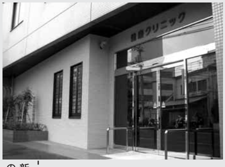
新しくなった第二別館1階の正面玄関

しかし、関係者の役割が不明確で、社会全体としての取り組みや、目標達成に向けた効果的なプログラムが十分でない点が課題となっていました。