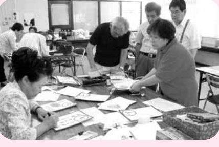
昨年度、呉市安浦地区公衛協が取り組んだ食のチェック事業「食育かるたづくり」