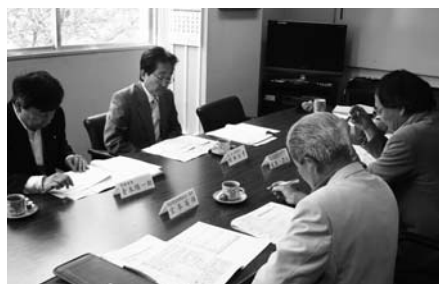
基金運用委員会での審査の状況