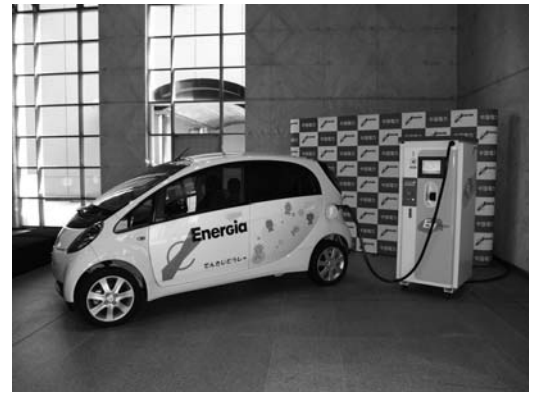
電気自動車 (i-MiEV) と急速充電器

自動車の普及に向けて、各地で急速充電器の設置などのインフラ整備が進んでいます。広島県でも本年から、行政と民間が一体となったカーシェアリング制度の実施を予定しています。制度の内容は、広島県がレンタカー会社を公募で選定し、そのレンタカー会社での電気自動車の購入や急速充電器の設置について補助を行い、整備・運営を委託し