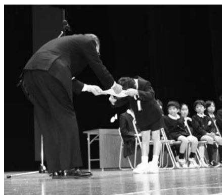
ポスター・標語コンクール (昨年の授賞式の様子)

いって第一次審査を行ったのち、入選作品を当協会に推薦する。その後、当協会設置の選考委員会において第二次審査を行い、各部門で最優秀賞、優秀賞、奨励賞を決定し、十一月九日の第五十一回広島県公衆衛生大会の席上において表彰を行う予定。なお事業終了後、報告書を事例集にまとめ、研修会や会議の資料として広く活用する予定である。(地域活動支援センター)