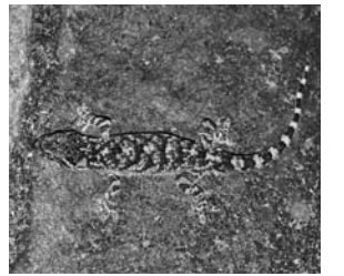
海辺の岩礁にいるタワヤモリ