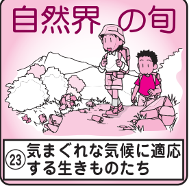
自然界の旬 気まぐれな気候に適応する生きものたち