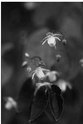
スズフリイカリソウの一型