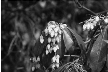
シシガシラ (上左)、リュウウメンシダ (上右)、ウメ (中)、アセビ (下)