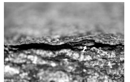
岩場の隙間に隠れる