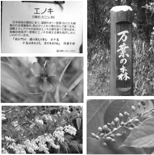
万葉の森の立看板(右上)、万葉植物に掛かる説明板(左上)、この時期に美しい万葉植物スマレ(左中)、エゴノキ(左下)、ウワミズザクラ(右下)

①一億二千万の人々が見る日本の植物と、六百万人(万葉時代の人口)の人々が見た日本の植物には、どんな違いがあるのか。