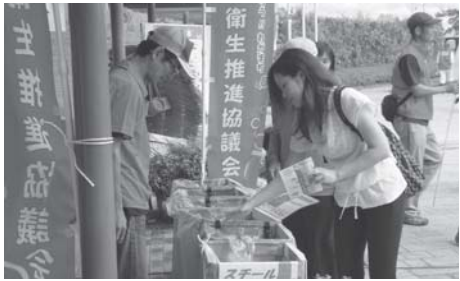
ごみ分別テストを受け る参加者

このイベントは親子連れでの参加が多いため、大人には「ごみ分別テスト」などを行って、正しい分別を呼びかけ