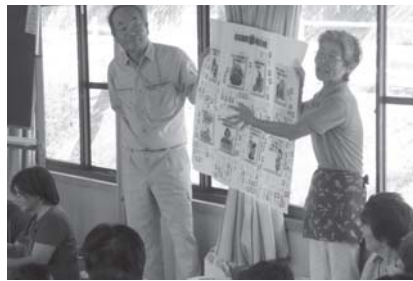
笑」8カ条の実践度チェックの発表

ながら、子どもたちにも関心を持ってもらえるように、ぬりえを準備して親子で体験できるよう工夫をした。参加者からは「初めて知った」「勉強になった」などの声が聞かれた。