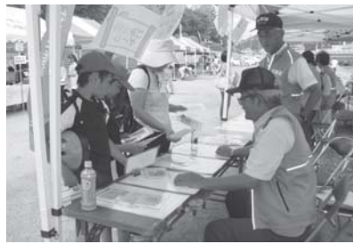
ごみ分別ゲームコーナーで分別を体験する児童

9月29日(日)に、海田町公衛協が主催する「エーコ」と瀬野川環境フェア」が、瀬野川河川敷で開催された。