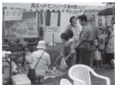
木エクラフトやゲームなどを楽しむ参加者(上)、長蛇の列となった飲料パックとトレットペーパーの交換ブース(下)

9月28日(土)、呉ポートピアパークで「くれエフエスタ2013」が開催され、多くの来場者でにぎわった。野外ステージでは、「ごみのないきれいな街づくり