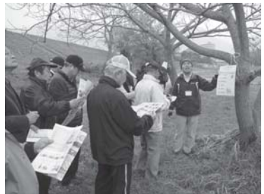
活動事例やノウハウを共有する参加者(上)、実際に屋外にてウォーキングプログラムを体験(下)