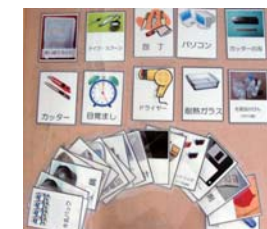
ごみの分別ゲームカード