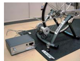
エネトレ (自転車発電機)