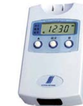
ワットアワーメータ