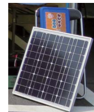
おひさま発電所mini (太陽光発電パネル)