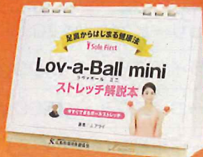
*解説本はパッケージ内の底部に入っています。