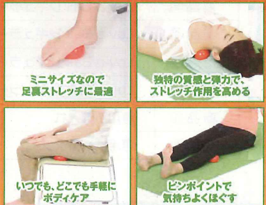
ミニサイズなので足裏ストレッチに最適