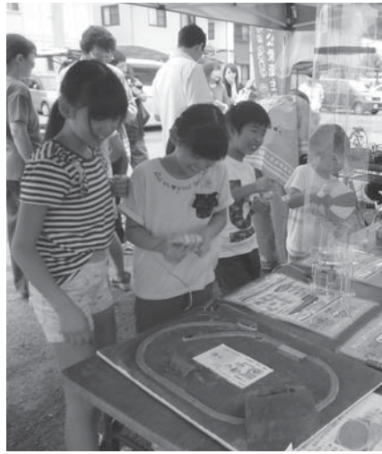
福山市でのイベントで使用される実験器

【第3位】はてんこミニテラックス 地域のお祭りやイベントで着用する赤いはてん。「ちよっと待つ