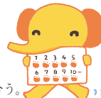
▲ウォーキングPRキャラクター「あるくソウ」