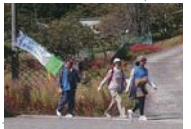
▲公衛協の旗を持ってPR

今年で第8回となるウォーキング。参加者全員が青色のベストを着用し、地区内を散策しながら見聞を広め、親睦を図った。中間地点ではお手洗いの協力やお芋、イチヂクなど差し入れの提供があり、和気あいあいと進められた。