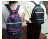
スタッフ用ナップザック