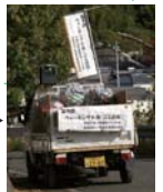
ごみを回収した軽トラ

ごみ拾い追放キャンペーンとウォーキングを組み合わせて実施。沿道の不法投棄されたごみを回収しながら歩き、参加者はその量の多さに驚いていた。