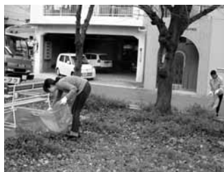
事務所近くの公園清掃