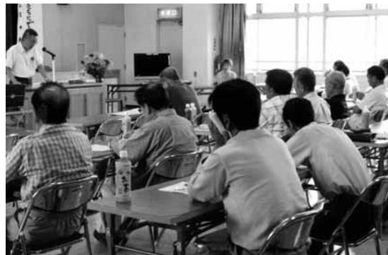
脱温暖化の意識を向上させるために開催された学習会

脱温暖化の意識を向上させるために開催された学習会。参加者は、パネルや実験器を使っての脱温暖化の説明、プロダクトの委員の意識統一が図れたこと、大きな成果である。また、町内のエコショップなどを紹介したオリジナルビデオも好評で、身近な取り組みのPRにもつながった。