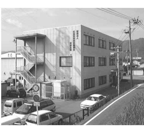
組織設立に向けた準備会

今後、緑花推進運動で培ったコミュニティの連携を活かして、脱温暖化をテーマにした活動の展開を期待する。