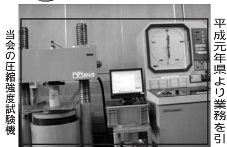
当会の圧縮強度試験機