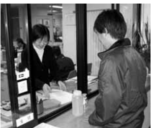
東部支所の受付窓口

今回の窓口日記は東部支所よりお届けします。東部支所は福山市西部の山手町にあります。水色の三階建ての建物で、芦田川の右岸土手すぐそば。土手を走行される時、ちょっと気に掛けてみてください。受付窓口には、毎日、検体持込の方やご相談の方などがいらしています。