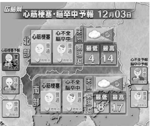
予報は毎日更新される http://www.hiroshima-med.jp/

心臓は、毎日約十回回の拍動を繰り返す筋肉のポンプです。心臓を養っている冠動脈が詰まると、筋肉に血液が届かなくなり、心筋梗塞になります。致死率の高い怖い病気です。