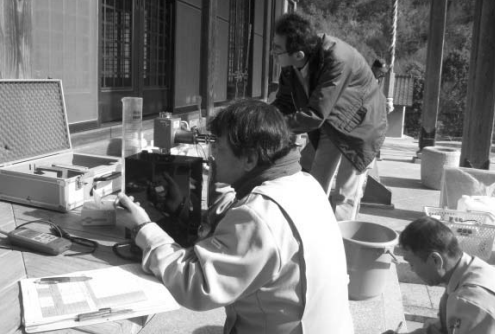
温泉水の現地調査

①総鉄イオン (Fe 2+ +Fe 3+ ) ②アルミニウムイオン (Al 3+ ) ③水素イオン (H + ) ④硫酸根イオン (SO 4 2- ) ⑤ラドン (Rn) ⑥水温 (25℃以上)