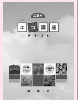
エコ講座専用テキスト (表紙)

講座開催は平成二十四年三月までとなっており、公民館や公衛協、社協などの協力を得てできるだけ多くの