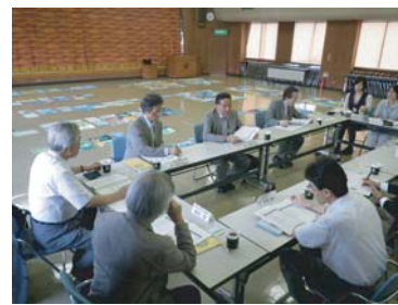
選考委員会の風景

環境啓発ポスター・標語コンクールの目的は地球温暖化を視座に、広い意味での環境保全対策を考えることにあり