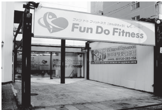
スタジオ正面(ピンクの看板が目印)