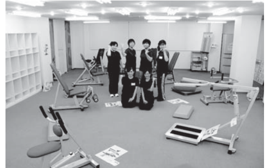
フィットネスの利用状況(上)、スタジオ内部とスタッフ(下)

オープン「かんほきょう」を紹介し、 広島県の平均寿命は、平成22年度調査では、女性は86.64歳、男性は79.91歳です。全国的にも長寿県なのですが、健康寿命となると話が違ってきます。健康寿命とは、介護を必要としない自立した生活ができる生存期間のことです。広島県の健康寿命は、女性が72.49歳、男性が70.22歳であり、全国道府県の中で女性は46位、男性は30位と