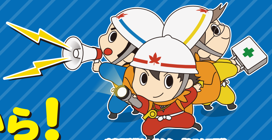
広島県防災キャラクター「タスケ三兄弟」